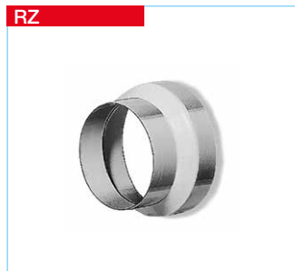
RZ Reduzierungen aus verzinktem Stahlblech bzw. Kunststoff*.