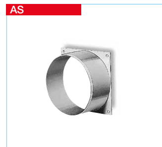
AS Anschluss-Stutzen AS Mit quadratischer Flanschplatte (102 x 102 mm) und rundem Stutzen (50 mm lang), aus Kunststoff. Zum Aufsetzen von Rohren (ND 100) auf plane Flächen.