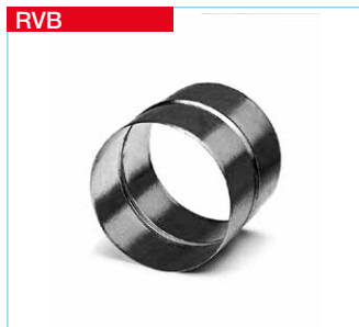
RVB Rohrverbinder aus Stahlblech, verzinkt.