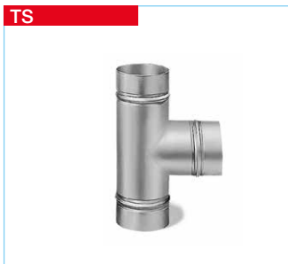
TS T-Stücke aus Stahlblech, verzinkt.