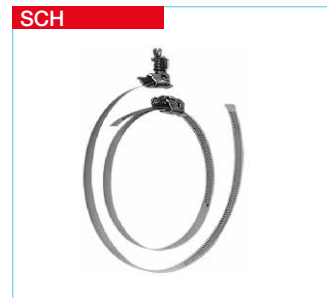
SCH Schlauchschellen Metallband mit Spannschloss. Lieferung als Verpackungseinheit mit jeweils 10 Stück.